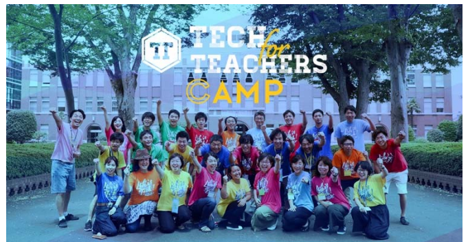
昨夏開催された教員向け IT キャンプ