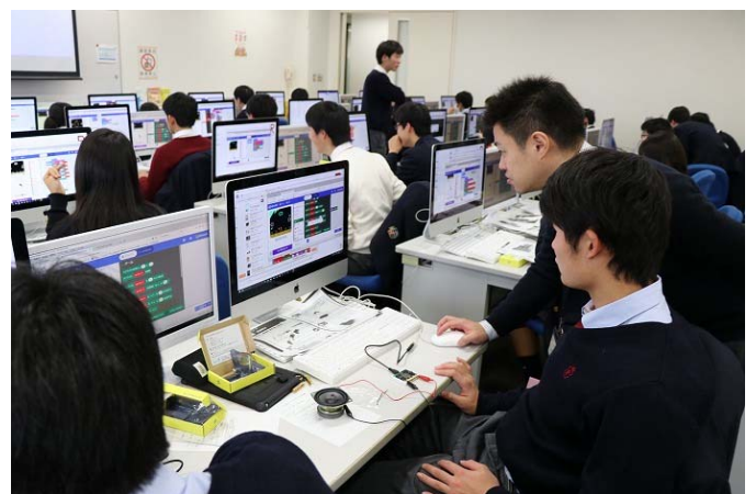
事前学習の様子（立命館守山高等学校）